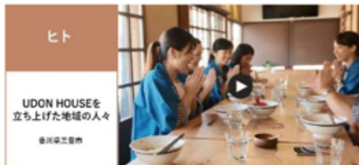
UDON HOUSEを 立ち上げた地域の人々 香川県三豊市