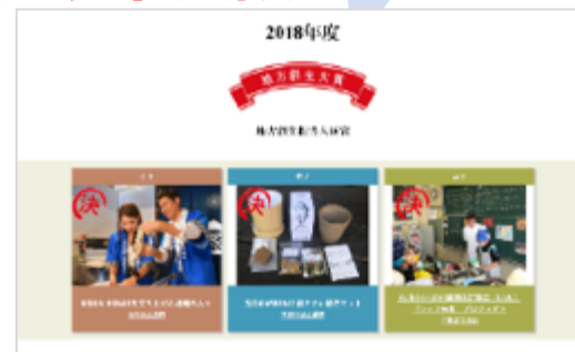
参加企業紹介も行う公式サイト