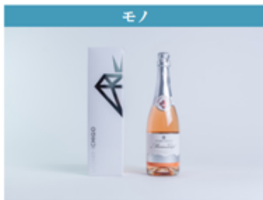
イチゴスパークリングワインミガキイチゴ・ムスー (宮城県亶理郡山元町)