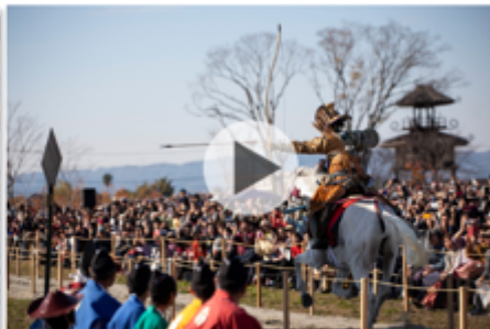
奈良田原本流鎗馬まつり 奈良県磯城郡田原本町