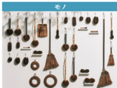
高田耕造商店 紀州産 からだ用棕櫚たわし 檜柄 (和歌山県)