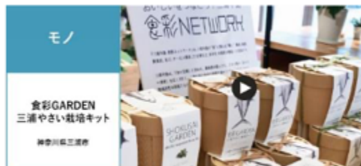
食彩GARDEN 三浦やさい栽培キット 神奈川県三浦市