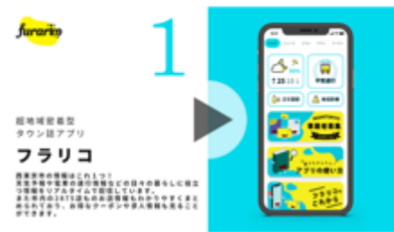
西東京市の情報はこれ1つ！ タウン誌アプリ「フラリコ」！ 東京都西東京市