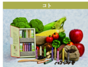
おやさいクレヨン (青森県青森市)