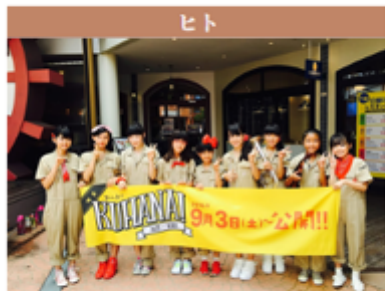
「KUHANA!」映画部 http://kuhana.jp/ (三重県桑名市)