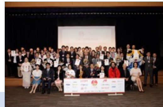
地方生担当大臣も出席の表彰式