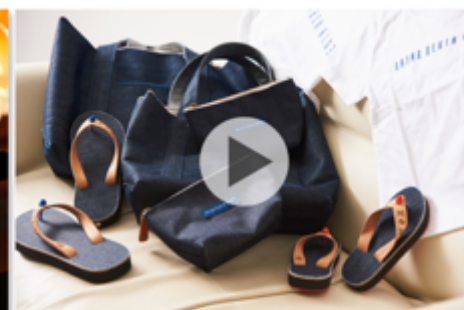
さとうきびの搾りカス「バガス」を活用した エシカルデニムプロジェクト 沖縄県浦添市