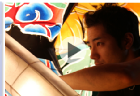
総青森ひば間接照明 青森県青森市