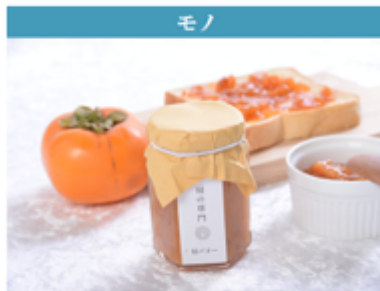
柿バター (奈良県五條市)