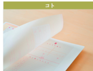
立川市プレミアム婚姻届 (東京都立川市)