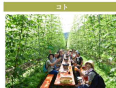
NextCommonsLab遠野 BrewingTonoチーム (東京都立川市)