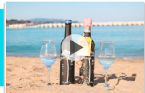
広田湾海中熟成プロジェクト。 ～海でお酒を沈める海中熟成体験による地域活性～ 岩手県陸前高田市