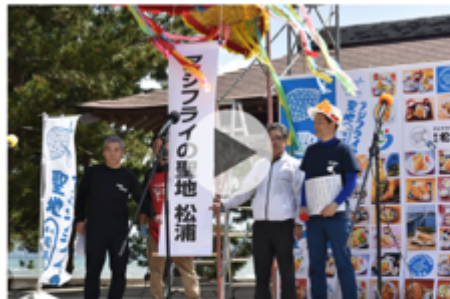
アジフライの聖地 松浦 長崎県松浦市