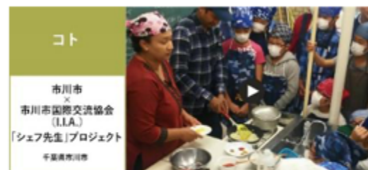
市川市 × 市川市国際交流協会 (I.I.A.) 「シェフ先生」プロジェクト 千葉県市川市