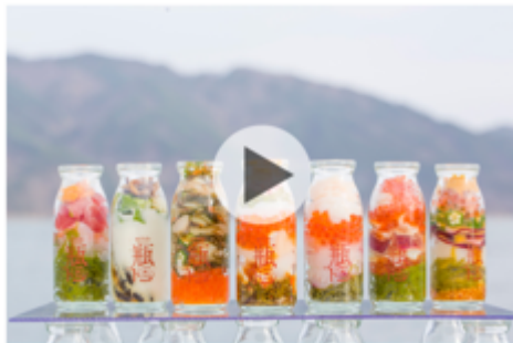
瓶ドンプロジェクト 岩手県宮古市